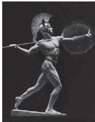
Wilhelm Wandschneider. Achilleus. 1909.

kreeka mütoloogia surnuteriigi neljast jõest.