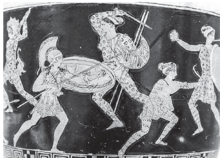
Amatsoonid Vana-Kreeka punasefiguurilisel ölinõul. U 420.

Amaryllis [ama'rüllis] Lamburineiu Theokritose ja Vergiliuse pastoraalides. → Võluv maatudruk.